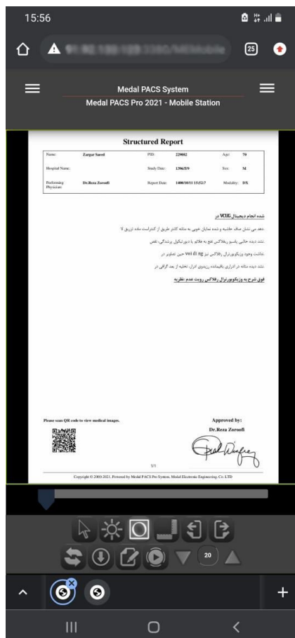
شکل ۴: صفحه گزارشات

۶) پس از فشردن دکمه گزارشات، صفحه گزارش مطابق با شکل ۴ نشان داده می شود: