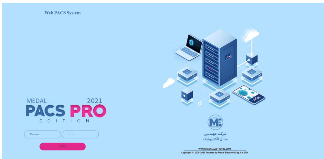
شکل ۱: صفحه ورود

(۱) پس از وارد شدن به تارنمای سامانه وب، صفحه ورود به سامانه مطابق با شکل ۱، نشان داده می شود: